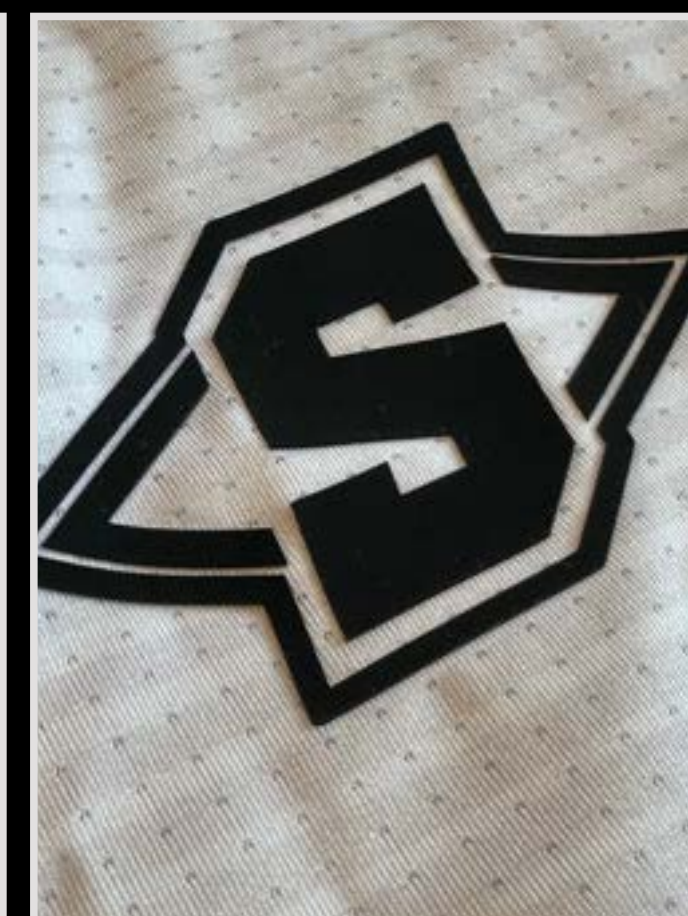
Mara de goma