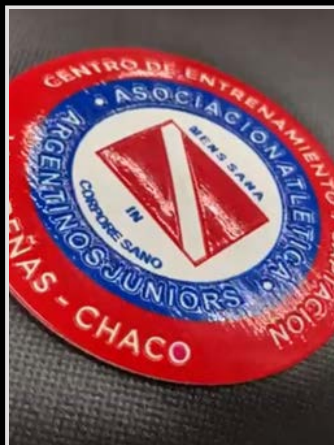
Escudo TPU GEL

Camiseta o short en tela drift con Escudos TPU GEL , Puños y Cuellos Tejidos con Color a Eleccion, Detalles en bordado y Nombre del Club realizado en textura con Relieve