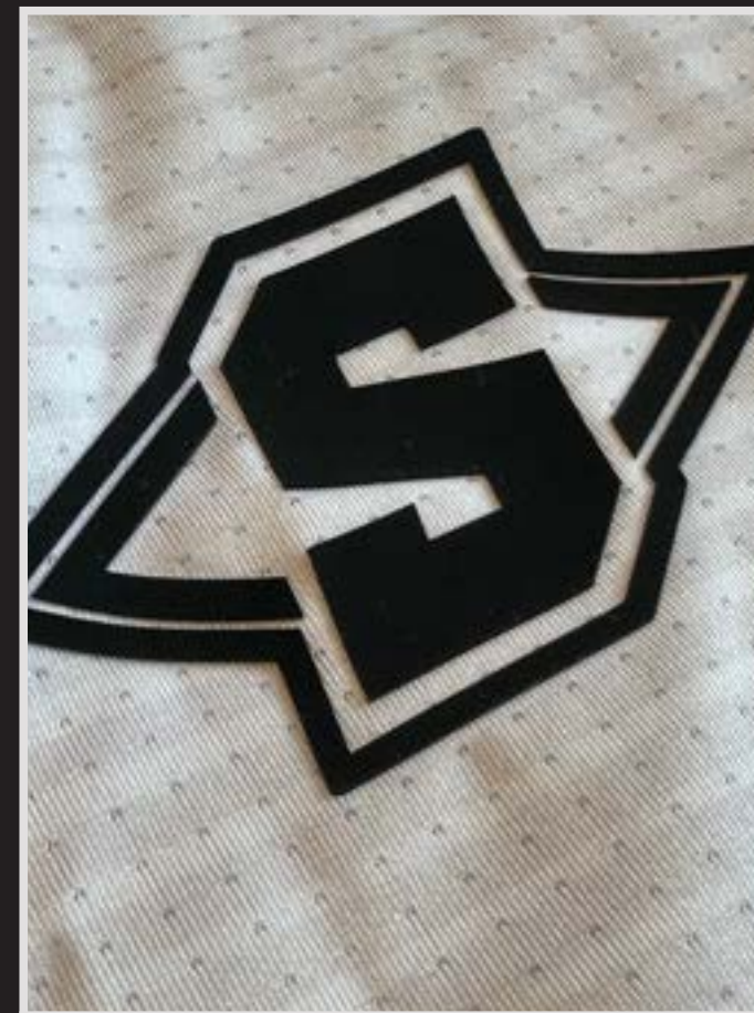
Mara de goma