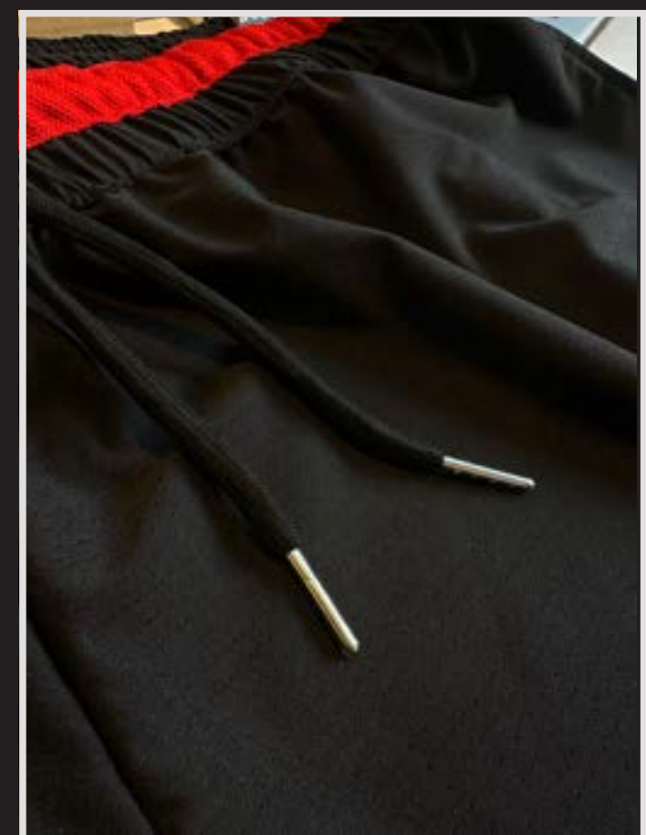
Short con cintura gruesa y elastico reforzado