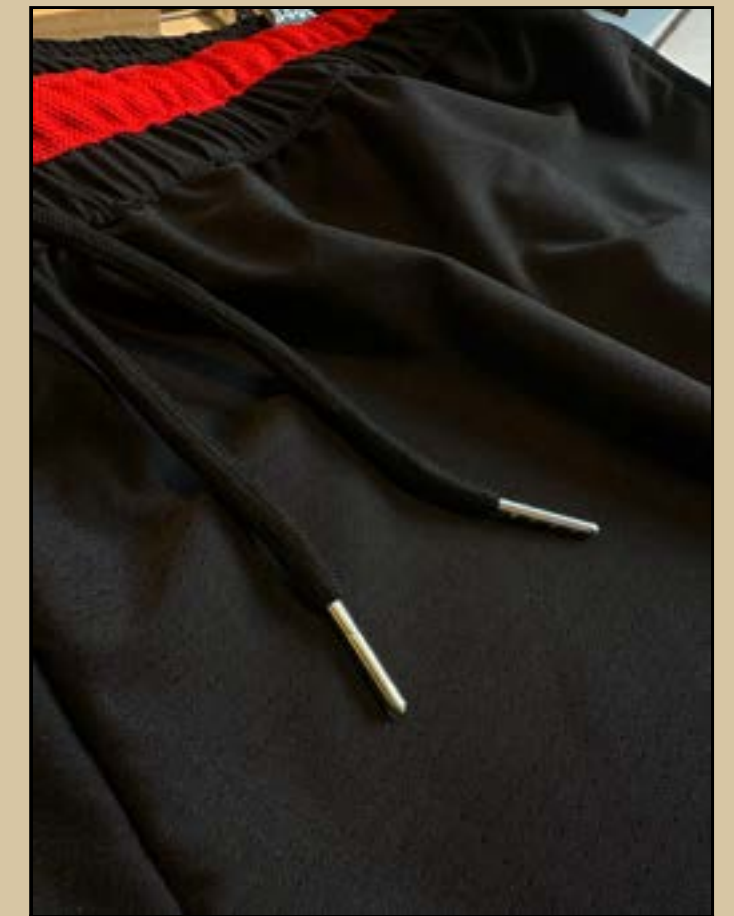
Short con cintura gruesa y elastico reforzado