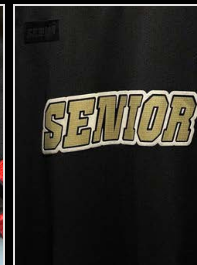
Nombre Club en textura con relieve