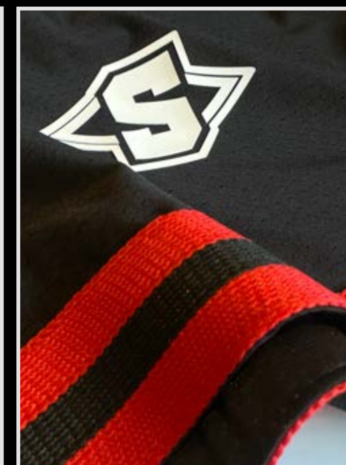
Short con cinta tejida