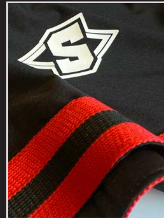
Short con cinta tejida