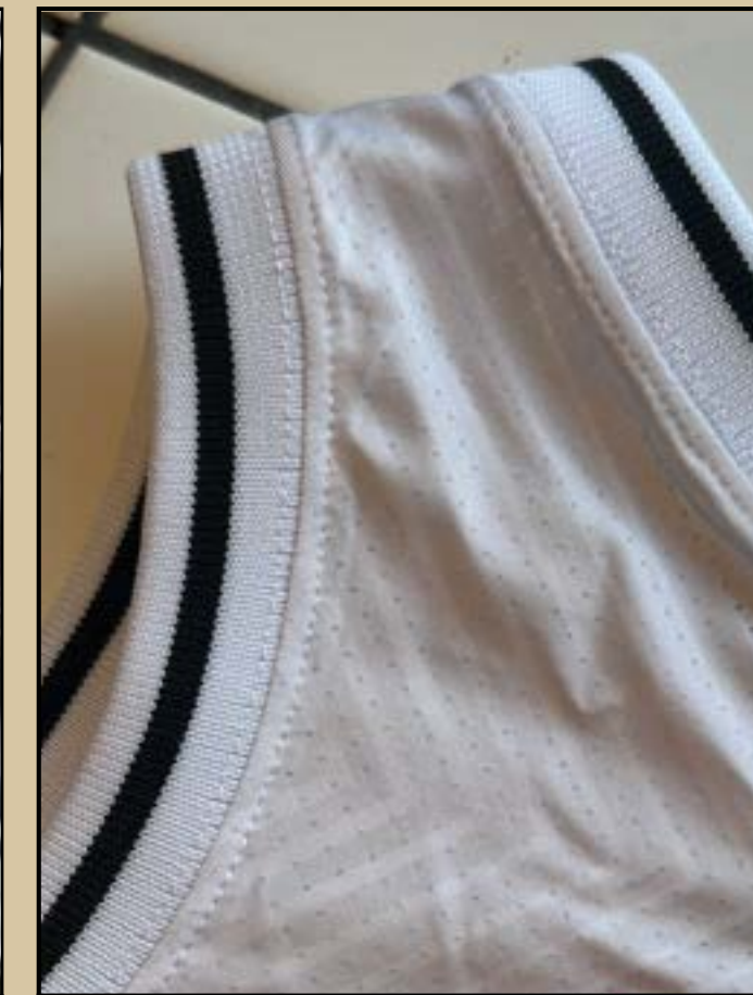
Puños y cuello tejidos - blanco y negro