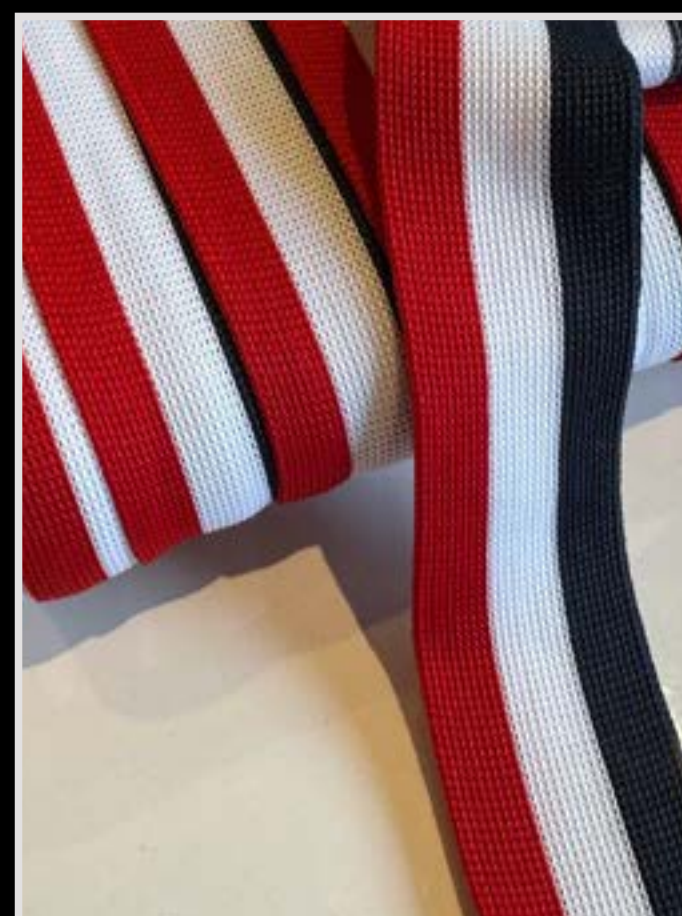
Puños y Cuellos Tejidos a color a elección